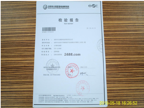
第三方产品质检报告