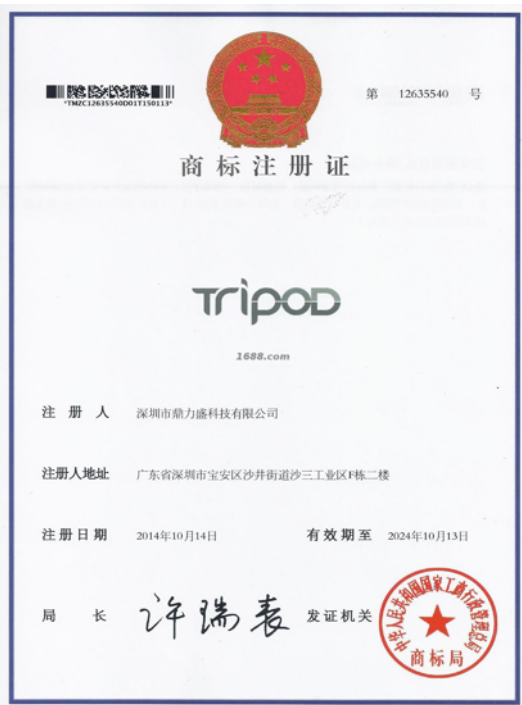
自有品牌证明材料