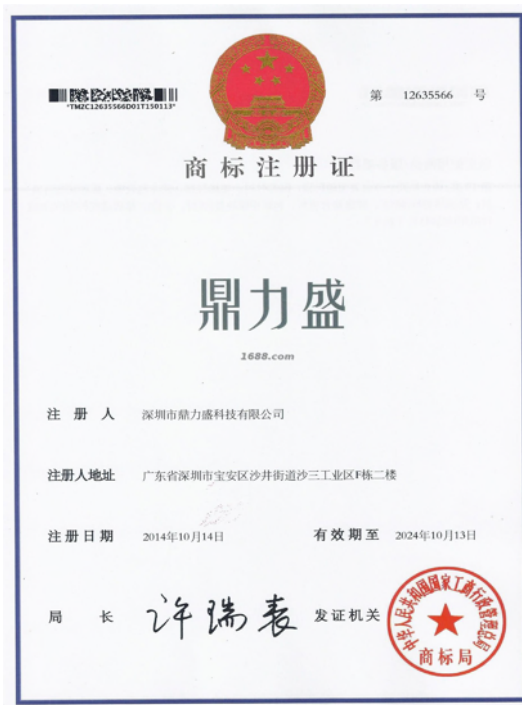
自有品牌证明材料