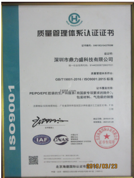
产品体系证书证明材料