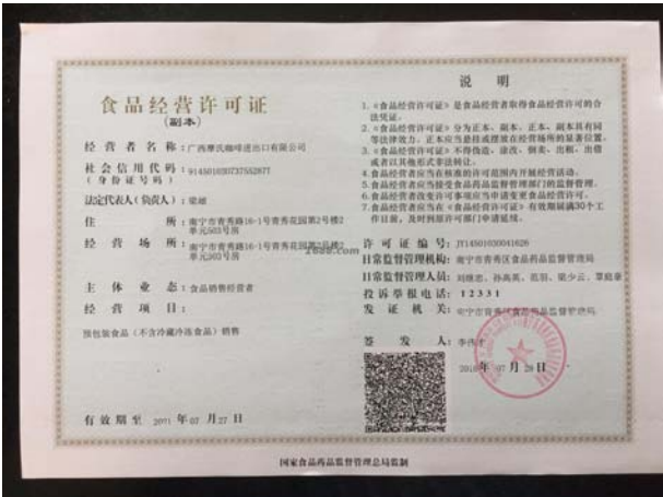
经营许可证证明材料