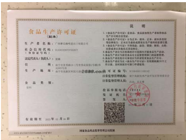
经营许可类证书照片