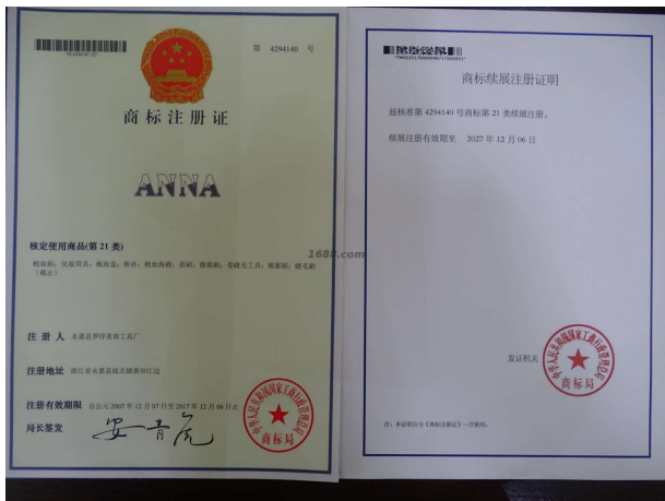
自有品牌证明材料