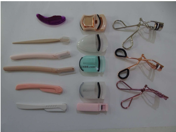
名称: 美容工具 货品来源: 工厂货源