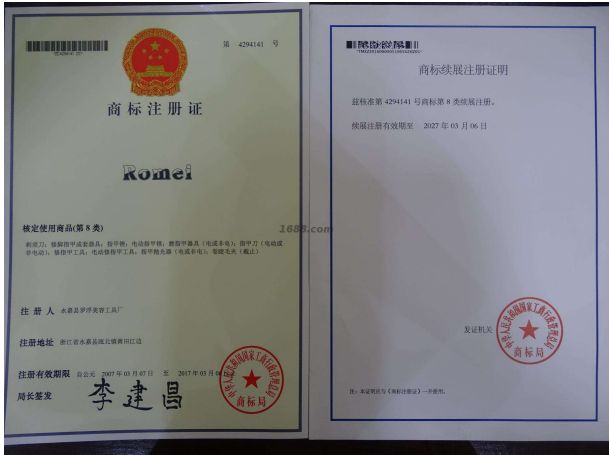
自有品牌证明材料