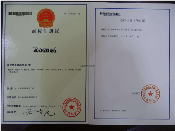
自有品牌证明材料