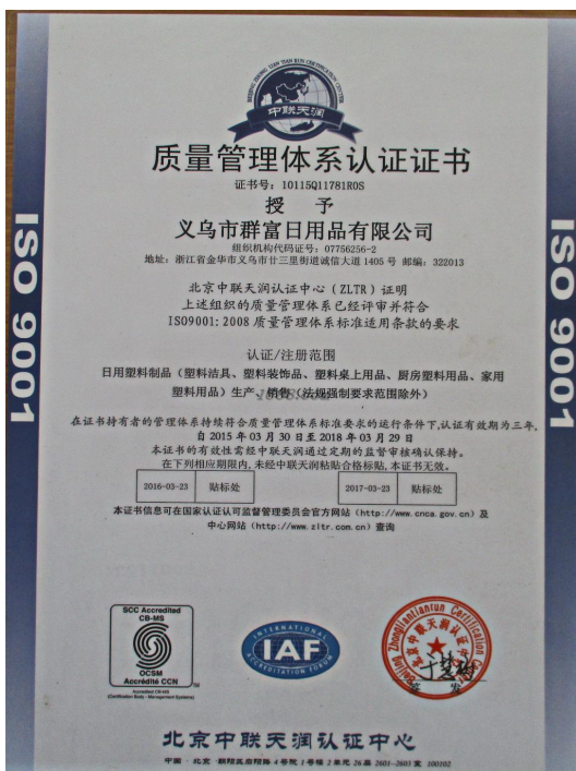
产品体系证书证明材料