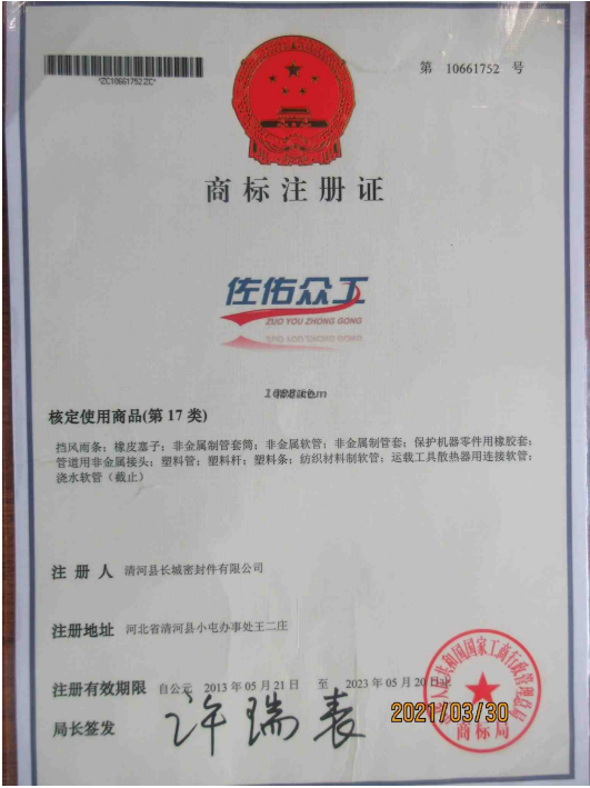
代理品牌证明材料