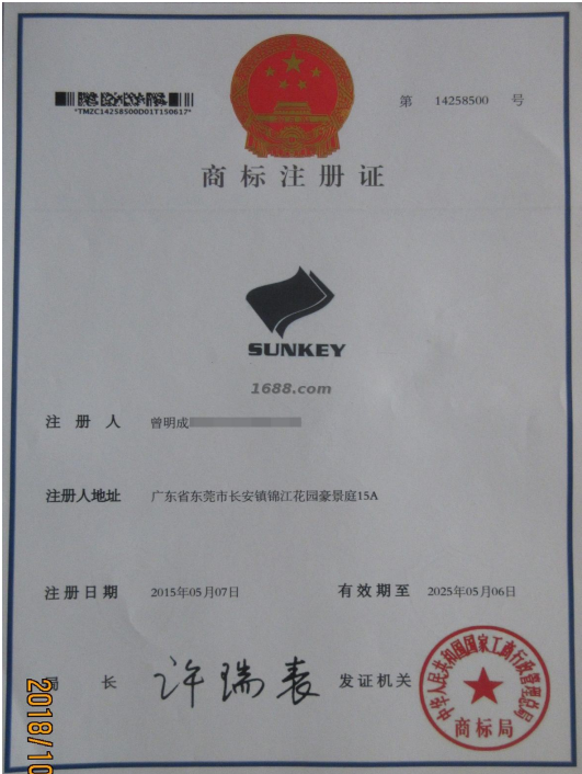
自有品牌证明材料