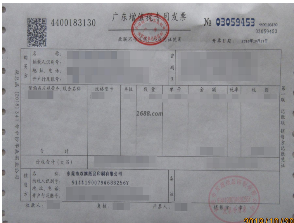
一般纳税人证明材料