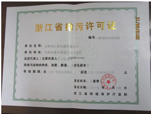
经营许可证证明材料