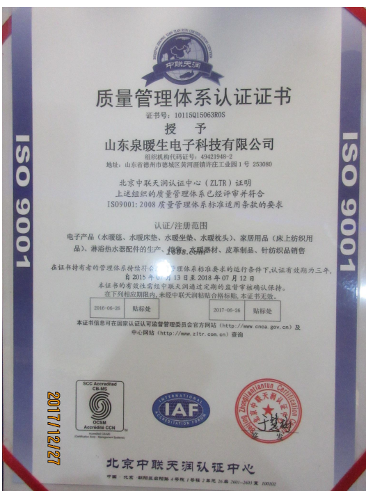
产品/体系类证书照片