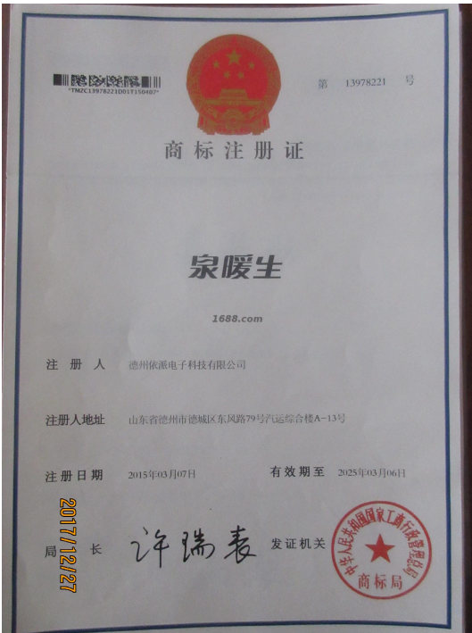
自有品牌证明材料