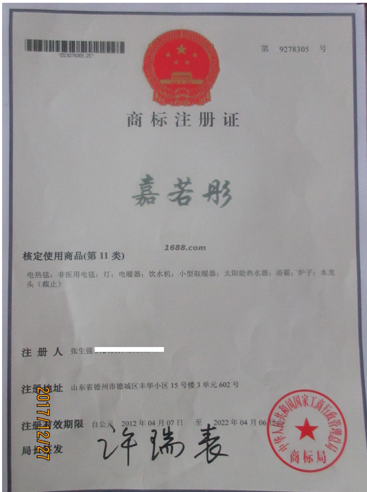
自有品牌证明材料