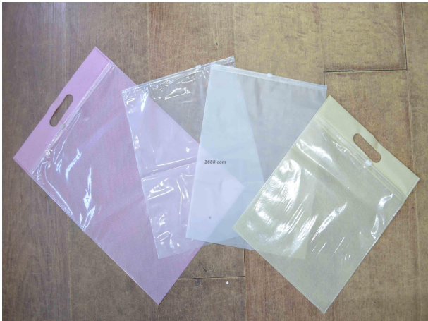
名称: 包装袋 近1年销量: 12000000 个