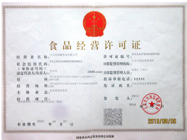
经营许可证明材料