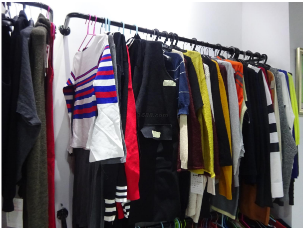
名称: 毛衣 近1年销量: 500000 件