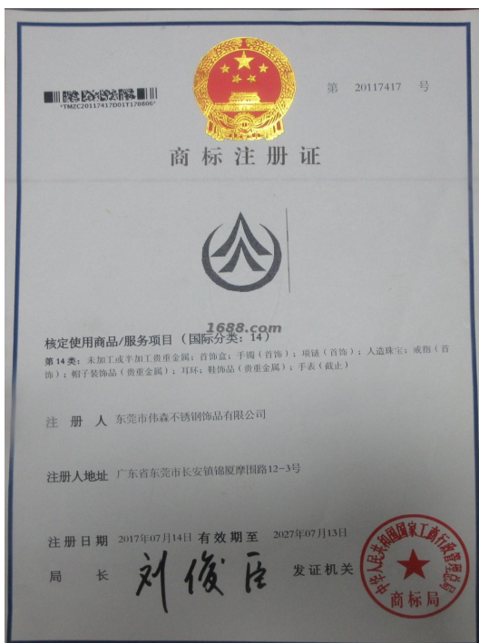
自有品牌证明材料