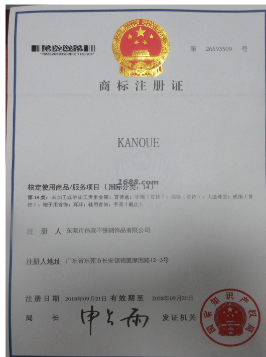
自有品牌证明材料