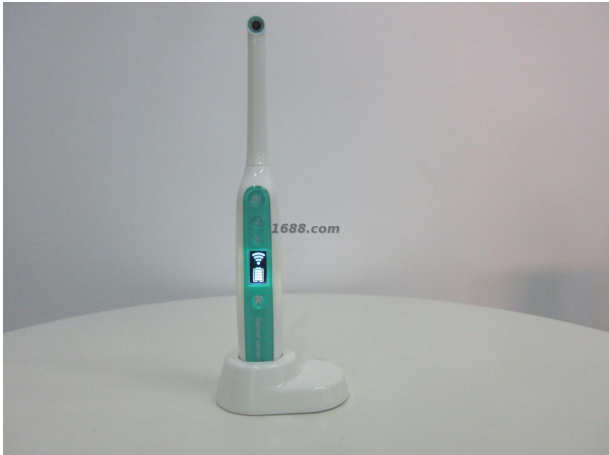
名称: 口腔内窥镜 货品来源: 工厂货源