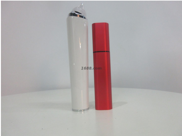
名称: 个人护理类 货品来源: 工厂货源