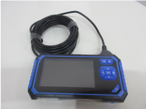
名称: 工业内窥镜 货品来源: 工厂货源