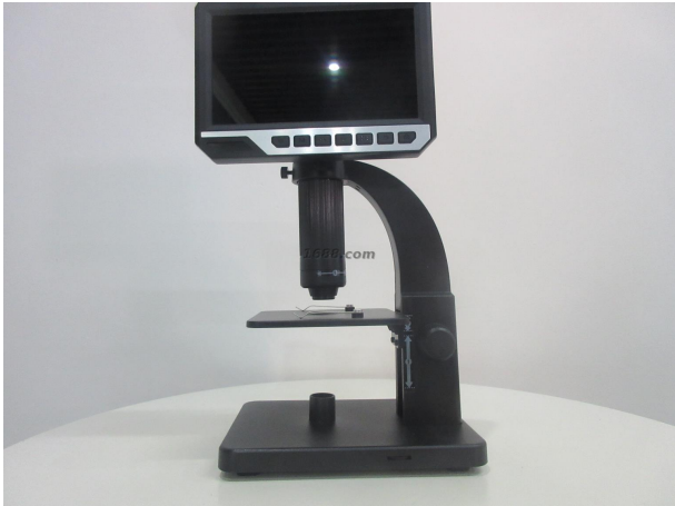
名称: 显微镜 货品来源: 工厂货源