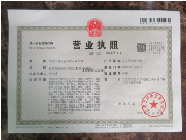
关联工厂营业执照