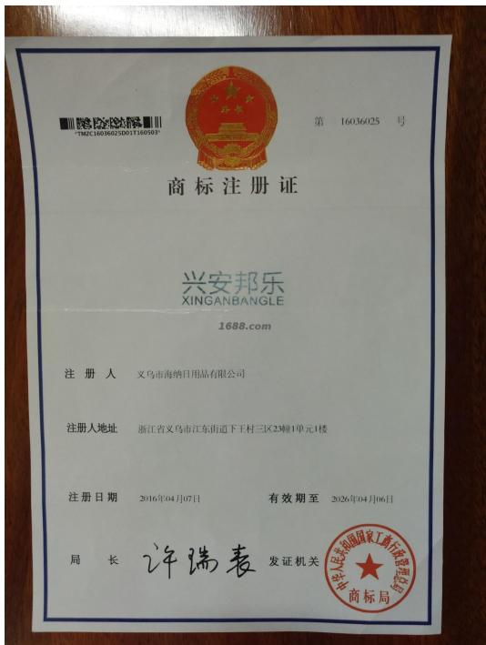
自有品牌证明材料