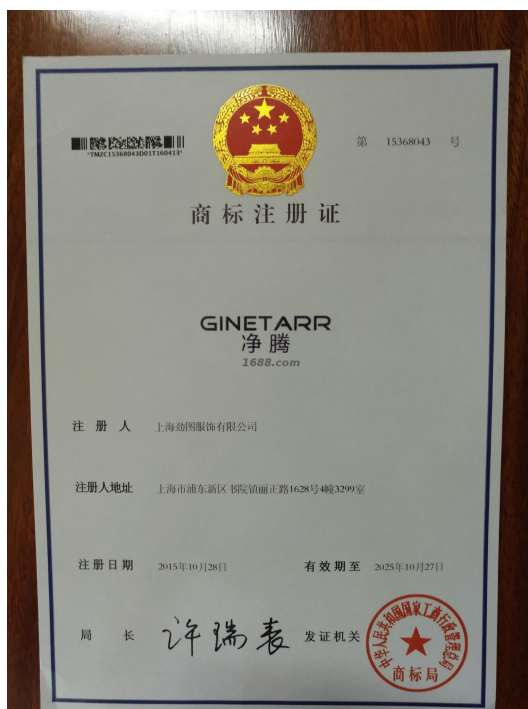
自有品牌证明材料