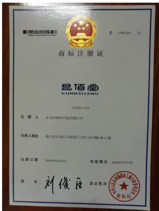
自有品牌证明材料