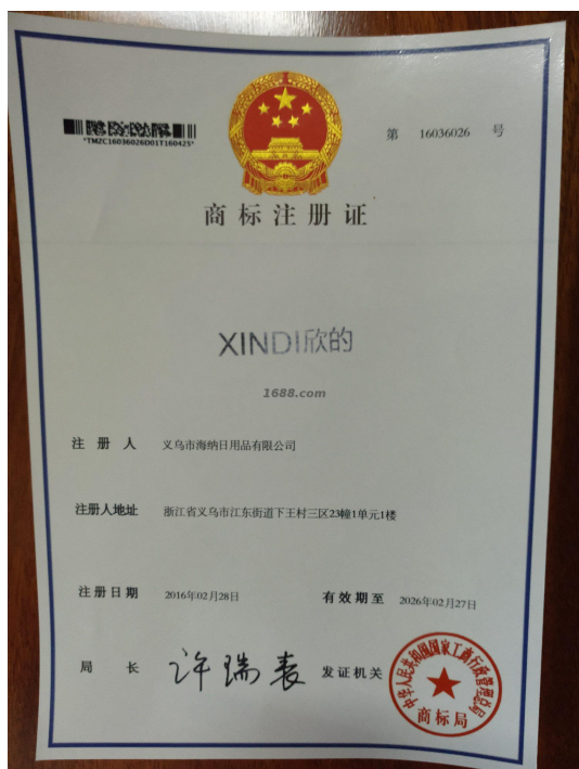
自有品牌证明材料