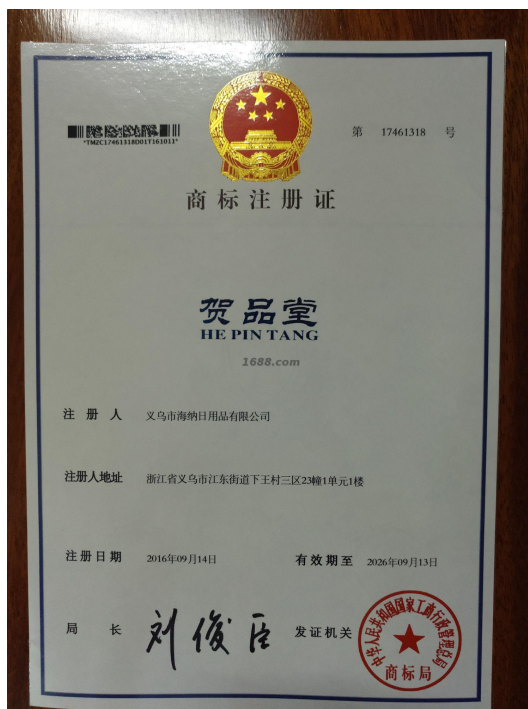
自有品牌证明材料