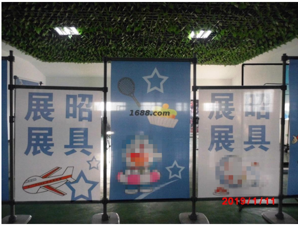
名称: 展示架 货品来源: 工厂货源