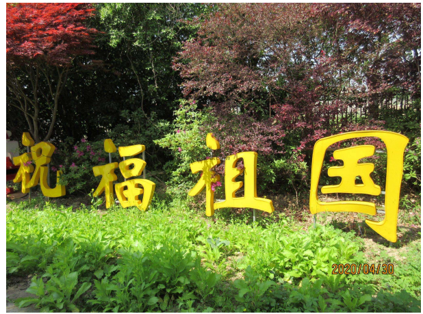
名称：亚克力发光字