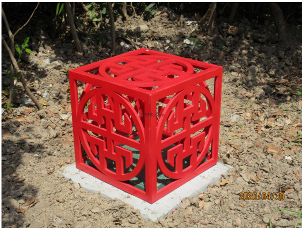
名称：雪弗板激光雕刻工艺品