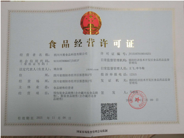
经营许可证证明材料