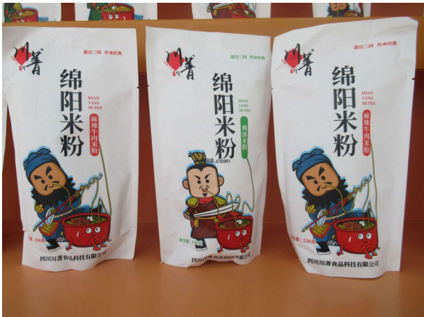
名称: 方便食品 货品来源: 工厂货源