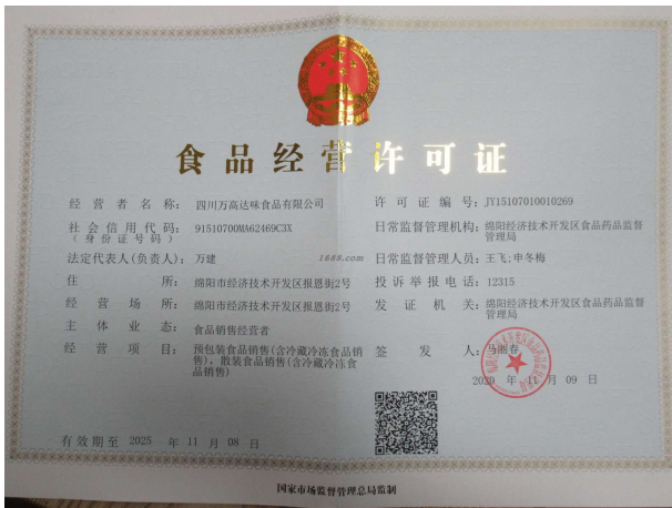
经营许可类证书照片