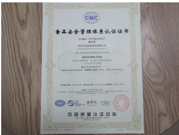
产品/体系类证书照片