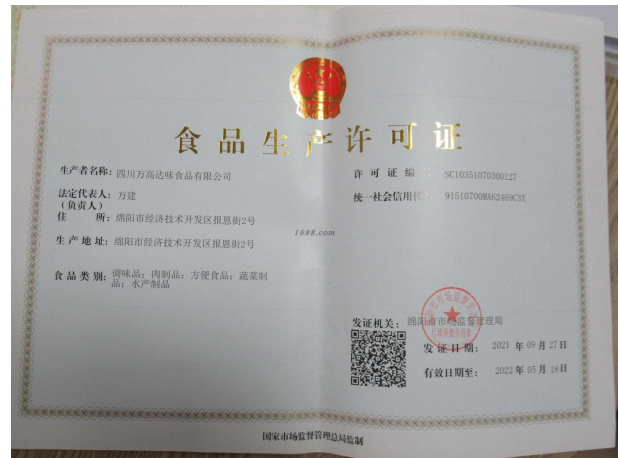
经营许可类证书照片