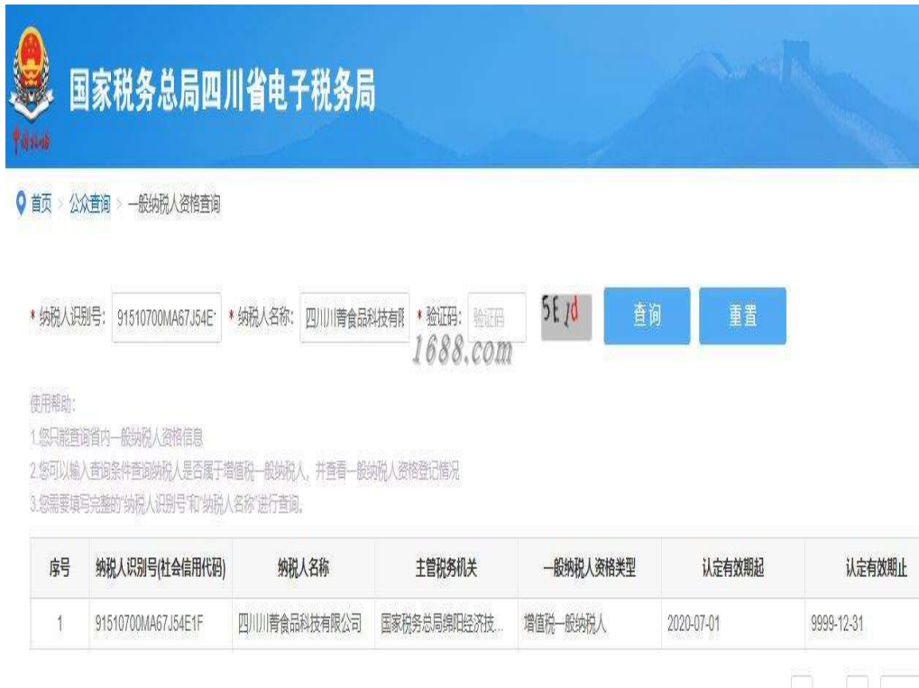
一般纳税人证明材料