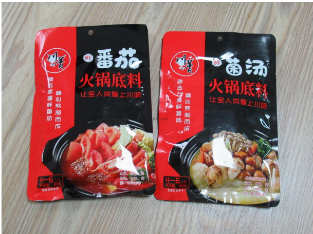
名称: 调味品 货品来源: 工厂货源