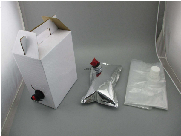
名称: 盒中袋 近1年销量: 15000000 个