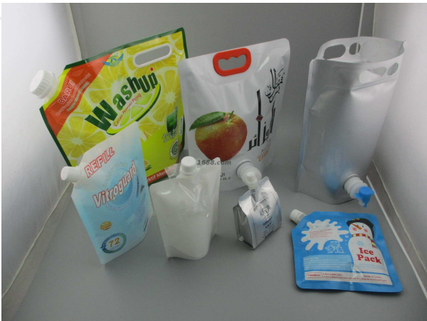
名称: 液体包装袋 近1年销量: 50000000 个