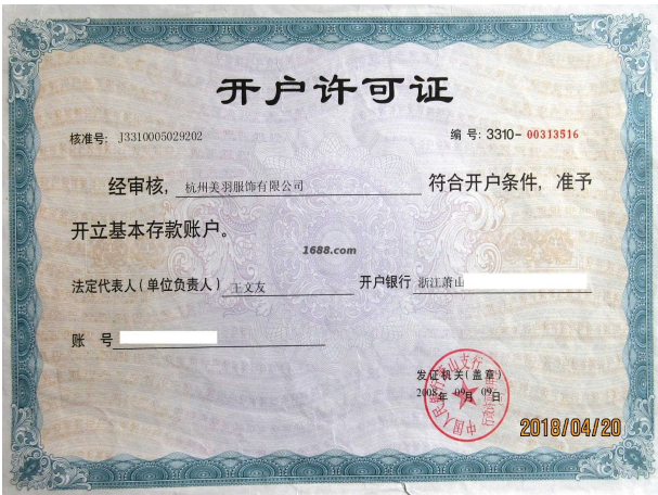
经营许可证证明材料