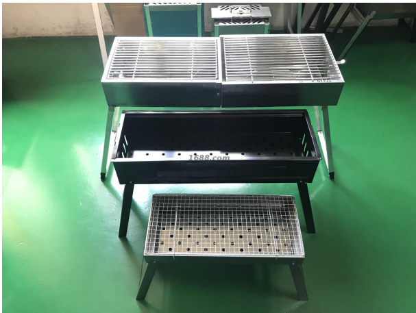
名称: 烧烤用具 近1年销量: 390000 台