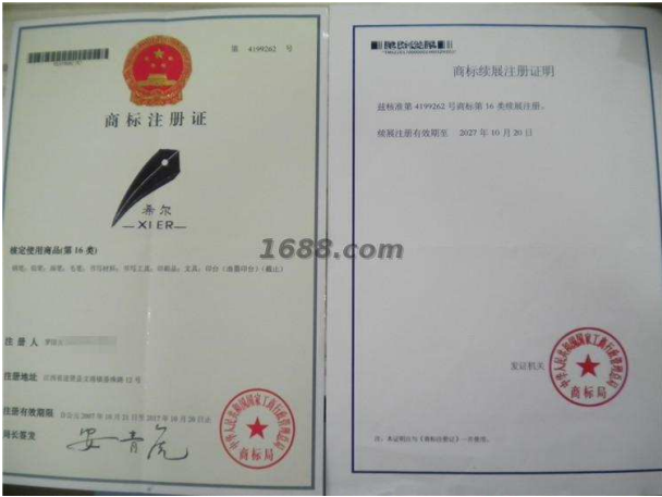
代理品牌证明材料