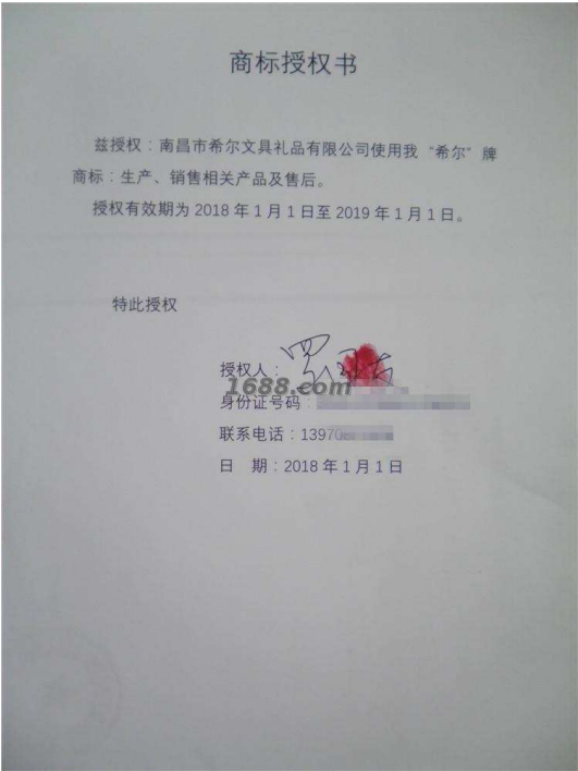
代理品牌证明材料