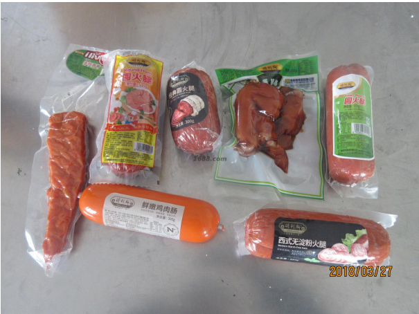
名称: 得利斯肉制品

线上平台数量： 4 线上平台名单： 1688网络平台 https://delisishipin.1688.com/ 天猫网上平台 https://delisisp.tmall.com/ 京东网上平台 https://mall.jd.com/index-192861.html 1号店网上平台 http://mall.yhd.com/index-1000072284.html