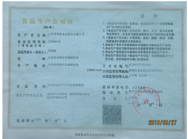
经营许可证明材料