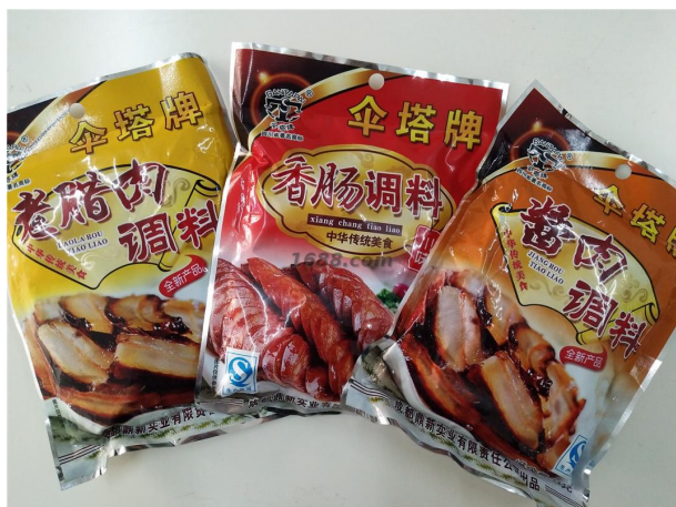
名称: 腌腊调料系列