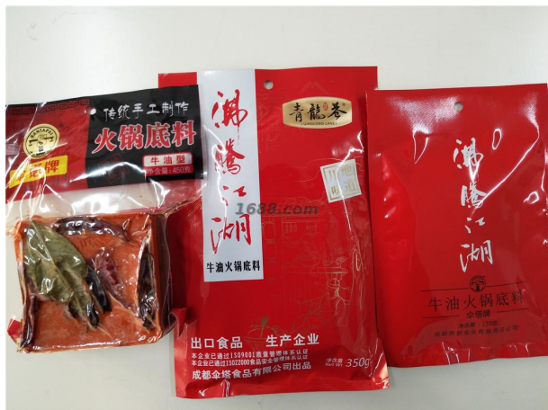
名称： 火锅底料系列