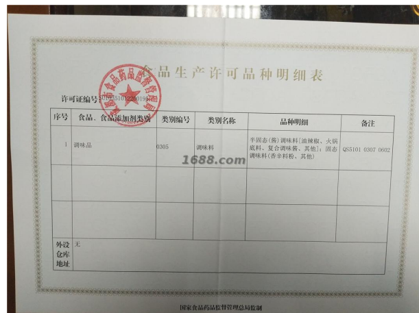
经营许可类证书照片