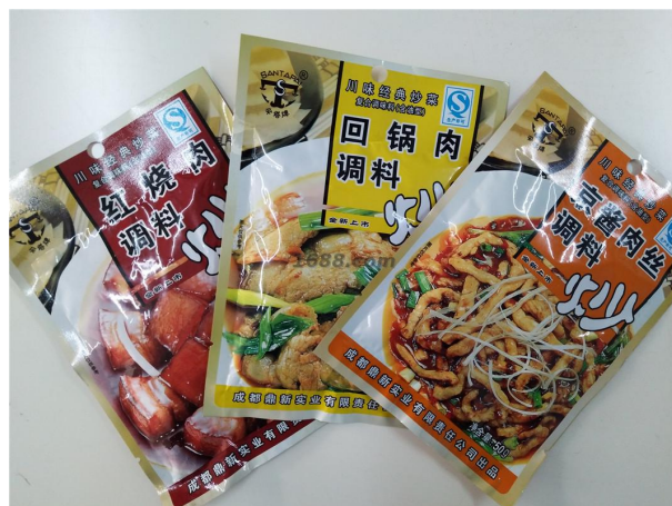
名称: 川菜调料系列