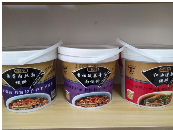
名称： 餐饮专供调料系列