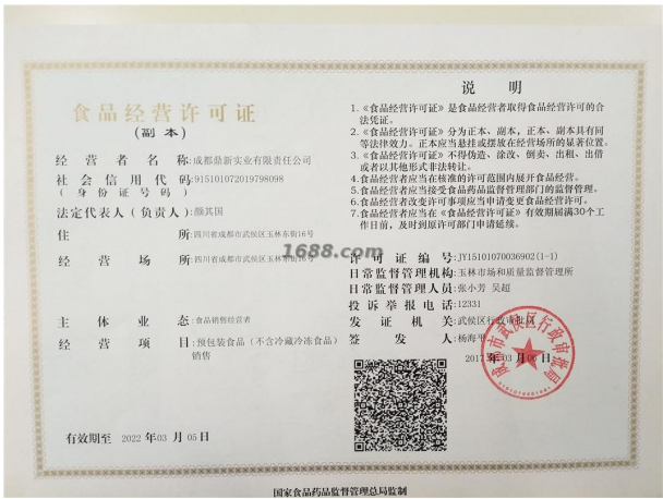
经营许可证证明材料