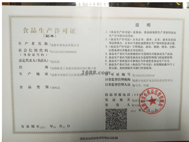
经营许可类证书照片