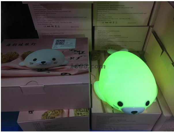
名称: 海豹灯 近1年销量: 190000 个