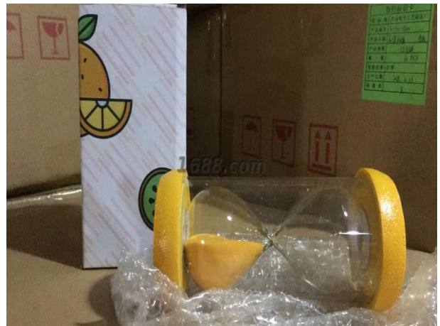
名称: 水果沙漏 近1年销量: 2600000 个