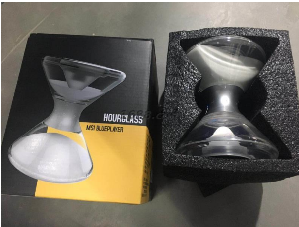
名称: 沙漏音箱 近1年销量: 2400000 个