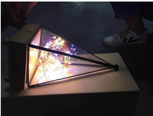
名称: 流光灯蓝牙音响 近1年销量: 170000 个