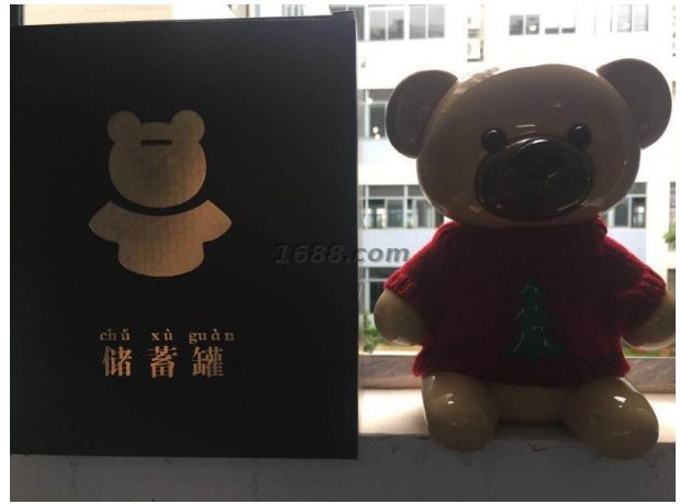
名称: 毛衣小熊 近1年销量: 170000 个