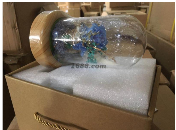
名称: 流光瓶 近1年销量: 270000 个