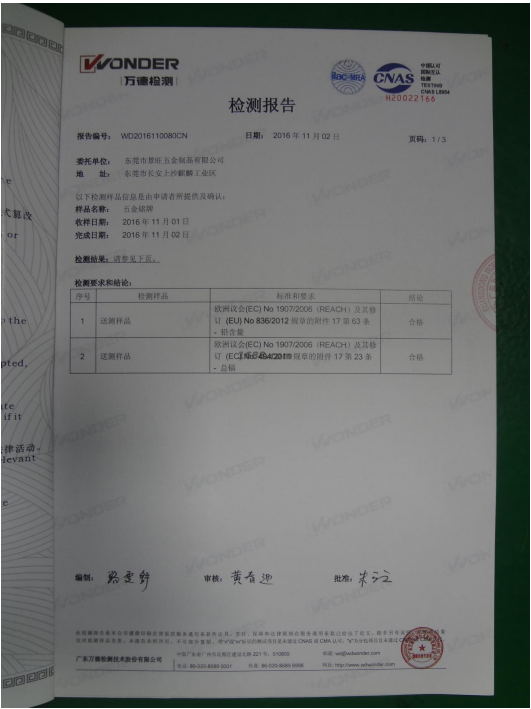
第三方产品质检报告