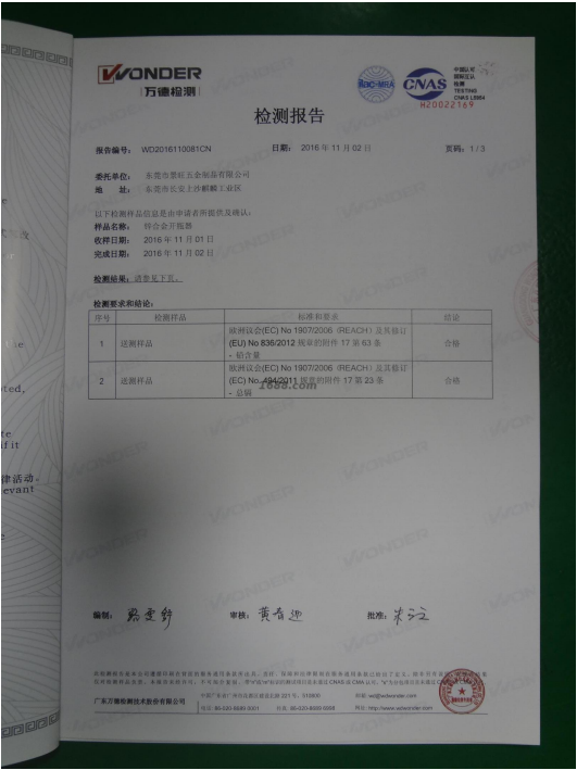
第三方产品质检报告