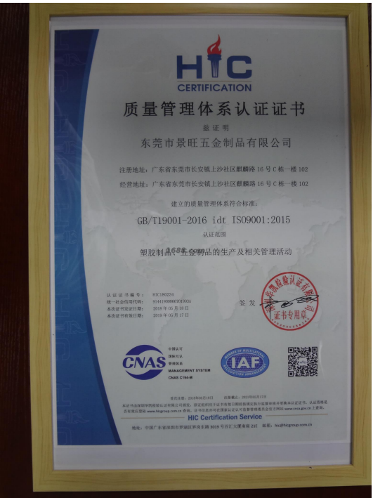
经营许可证证明材料