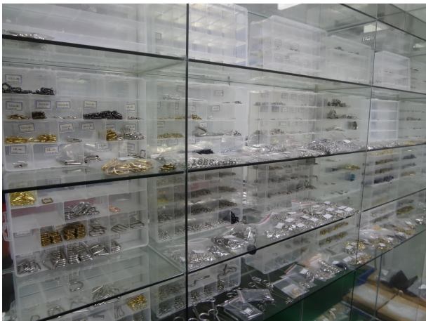
名称: 五金制品 货品来源: 工厂货源