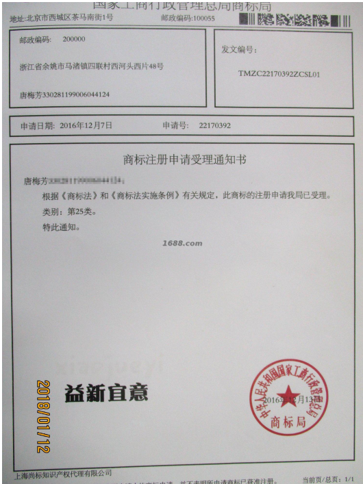
代理品牌证明材料