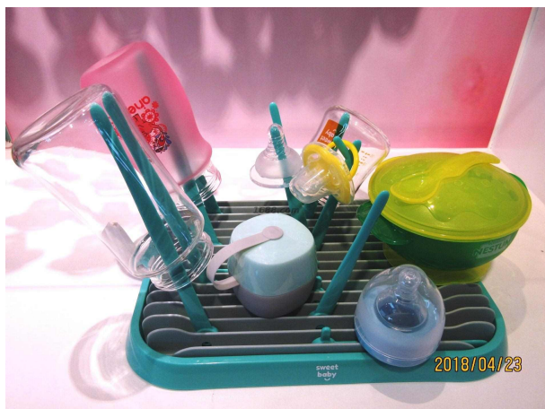
名称: 婴儿用品 (塑胶类)