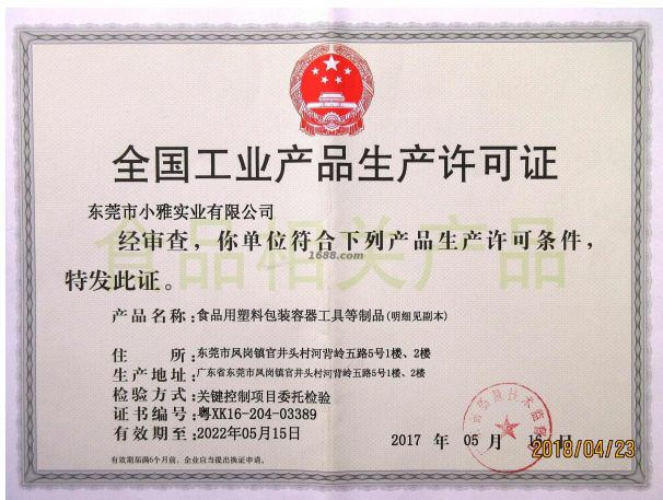
经营许可证明材料