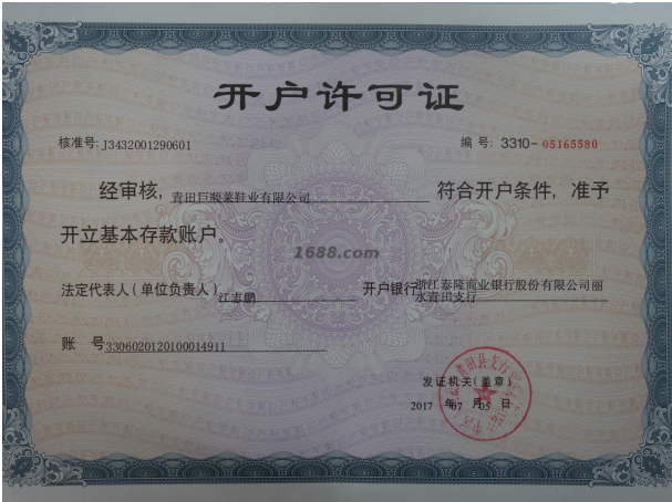
其他证书证明材料