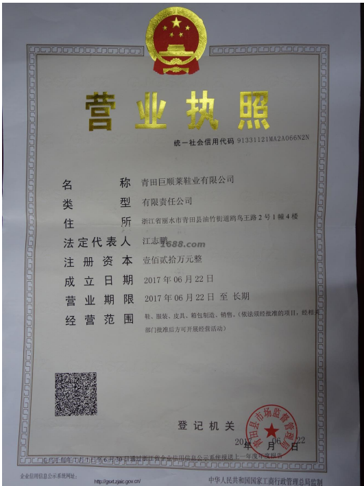
关联工厂营业执照