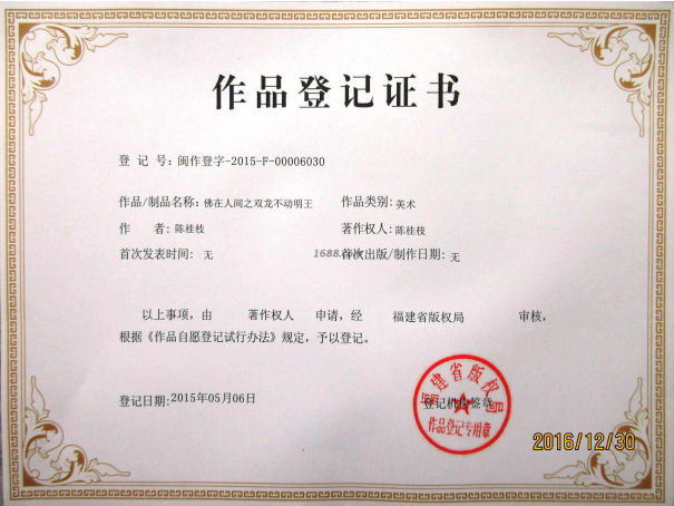
其他证书证明材料