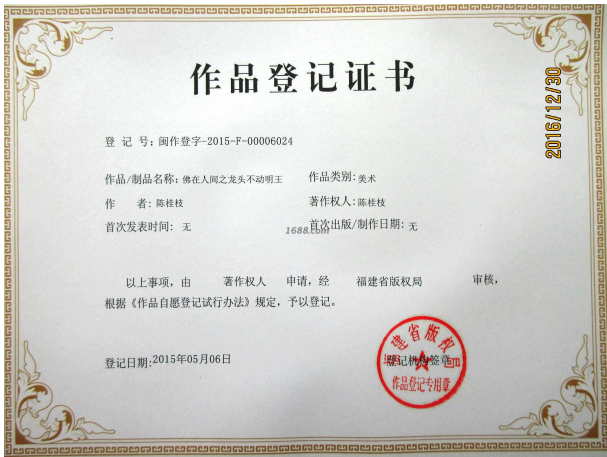
其他证书证明材料