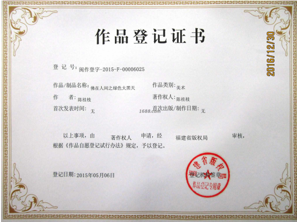
其他证书证明材料