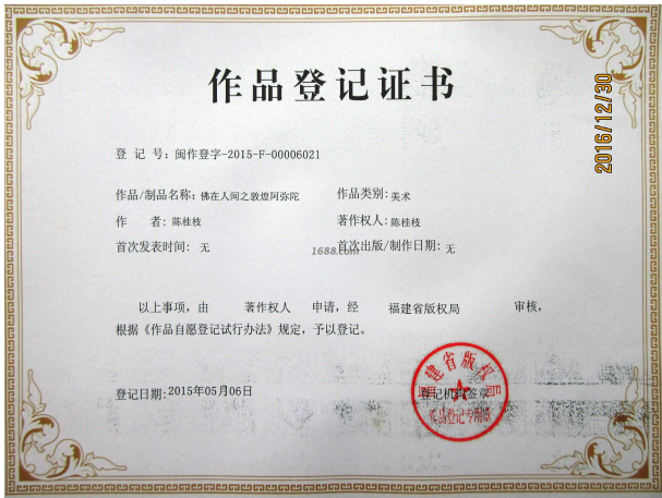
其他证书证明材料