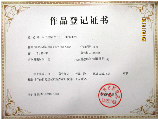
其他证书证明材料