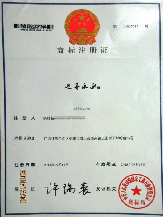
自有品牌证明材料