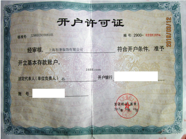
经营许可证证明材料