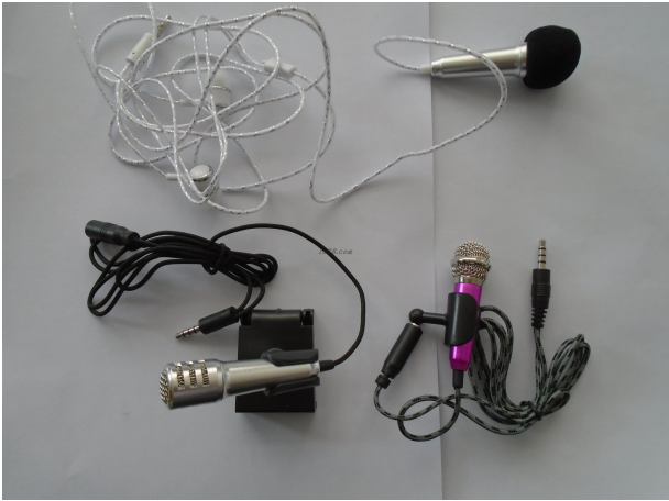
名称: 麦克风 货品来源: 工厂货源