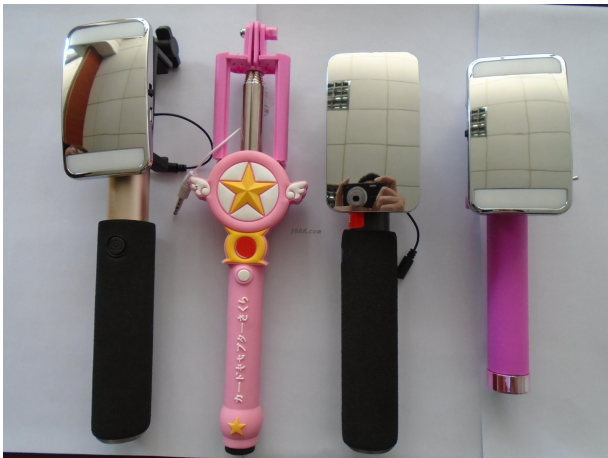
名称: 自拍杆 货品来源: 工厂货源