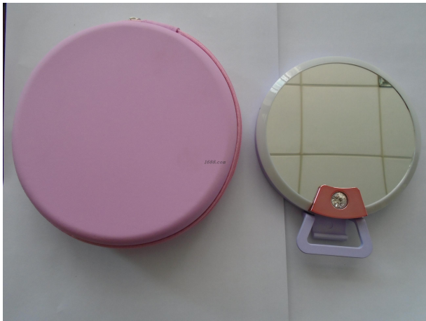
名称: 补光灯 货品来源: 工厂货源

线上平台数量： 1 线上平台名单： 1688平台 https://iproes.1688.com