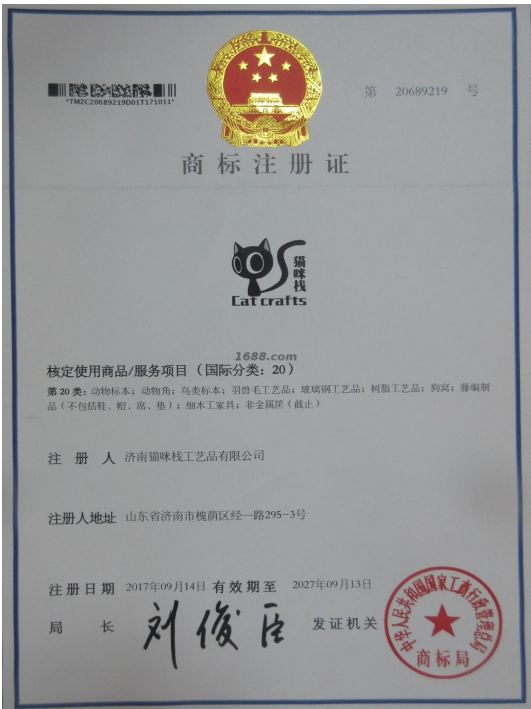
自有品牌证明材料