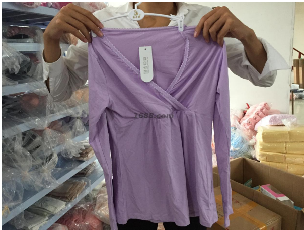
名称: 月子服 近1年销量: 100000 套