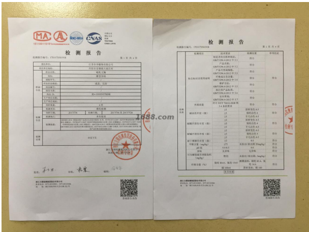
第三方产品质检报告