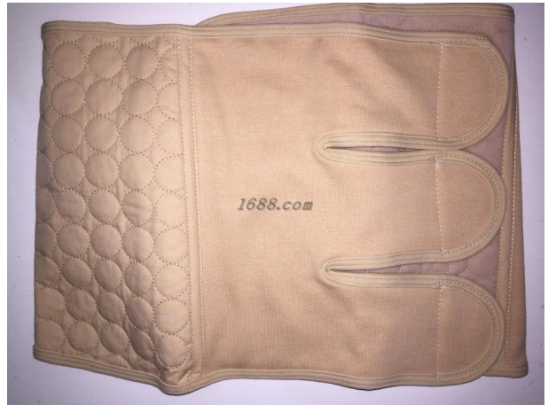
名称: 孕妇收腹带 近1年销量: 50000 件