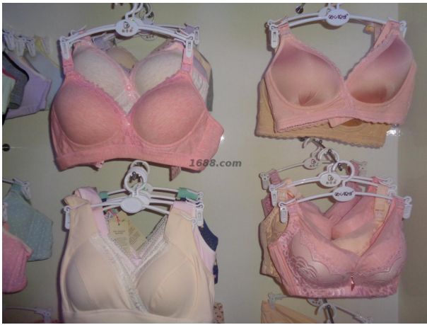
名称: 哺乳文胸 近1年销量: 500000 件