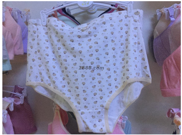
名称: 孕妇内裤 近1年销量: 500000 件