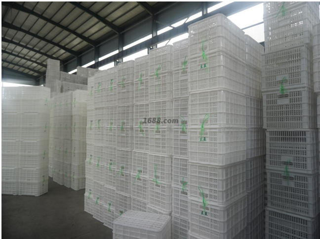
名称: 塑料制品 近1年销量: 5000000 个

线上平台数量： 1 线上平台名单： 1688 https://linyiliya.1688.com