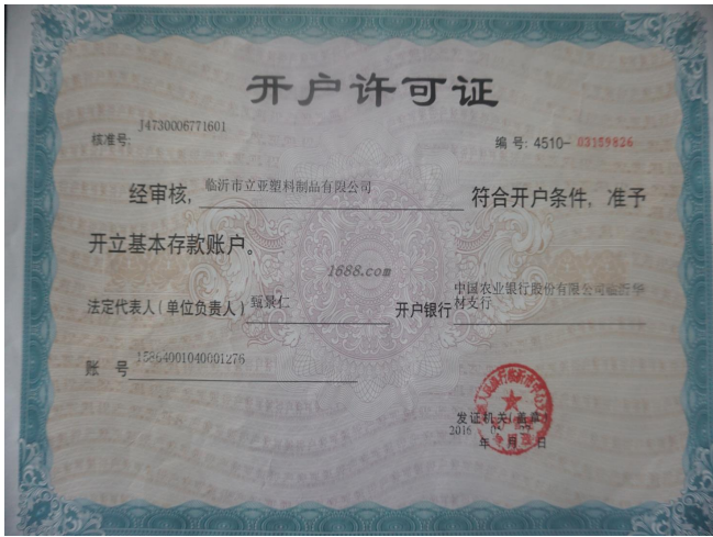
其他证书证明材料