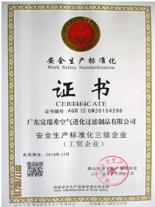
其他证书证明材料