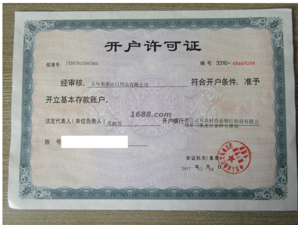
其他证书证明材料