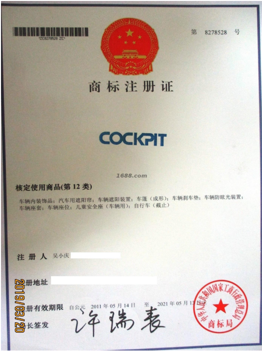
代理品牌证明材料