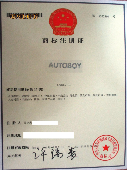
代理品牌证明材料