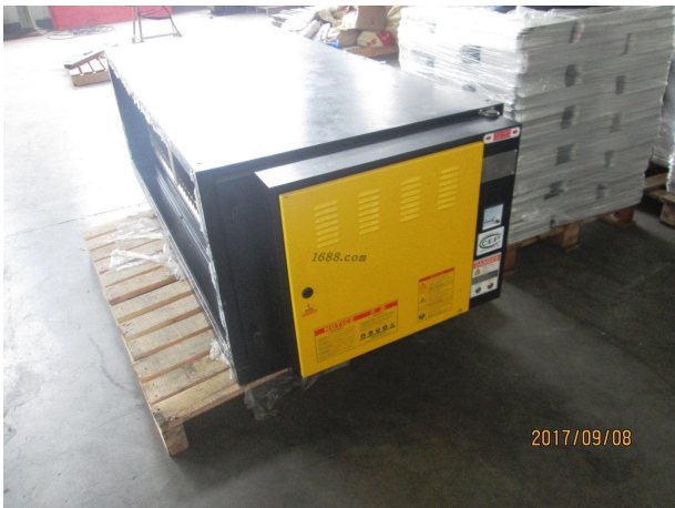
名称: 油烟净化设备