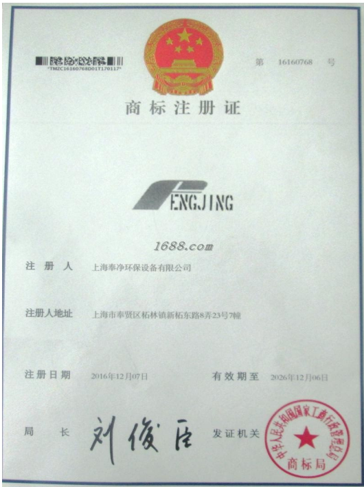
代理品牌证明材料