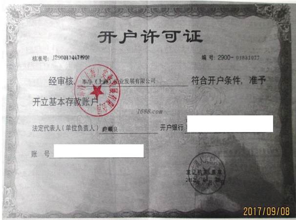
经营许可证明材料