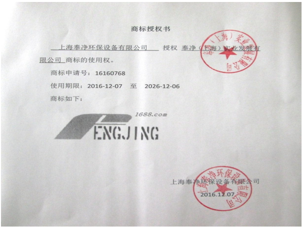
代理品牌证明材料