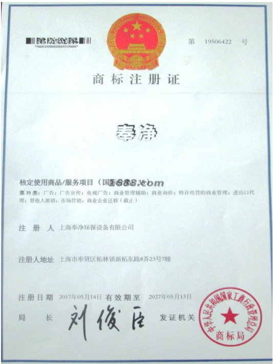
代理品牌证明材料