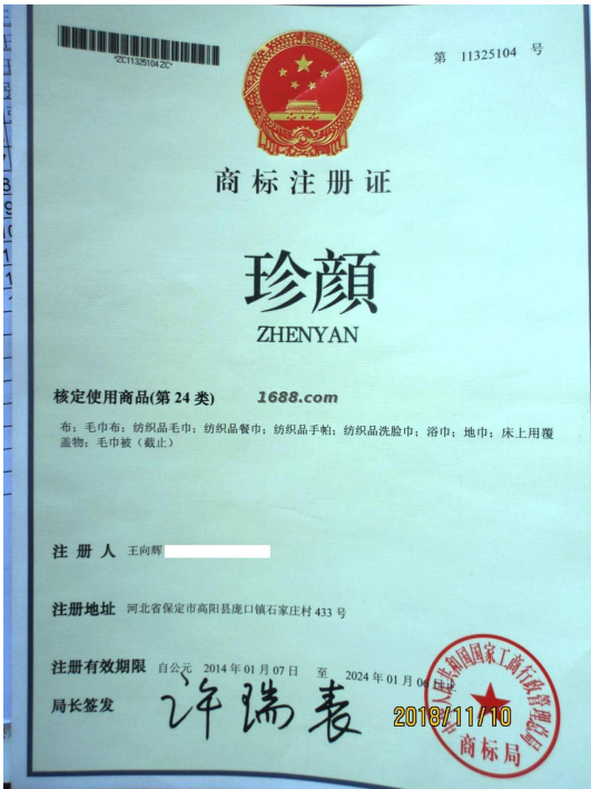
代理品牌证明材料