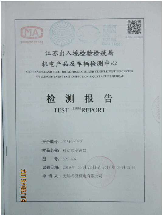
第三方产品质检报告

第三方质检产品名： 移动式空调器 第三方检测机构名： 江苏出入境检验检疫局机电产品及车辆检测中心