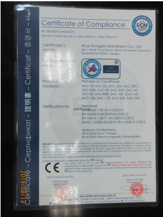
产品体系证书证明材料