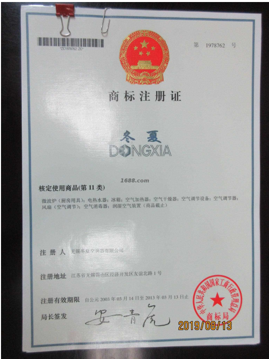
代理品牌证明材料