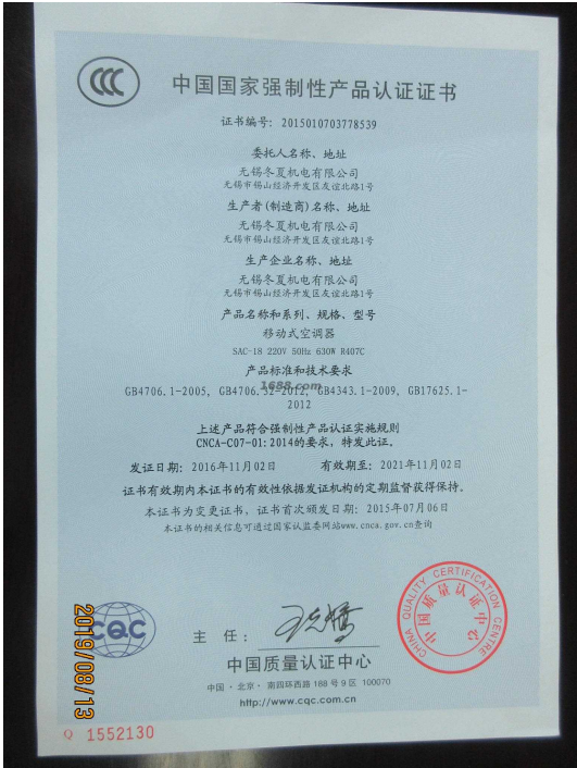
产品体系证书证明材料