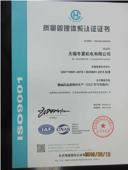
产品体系证书证明材料