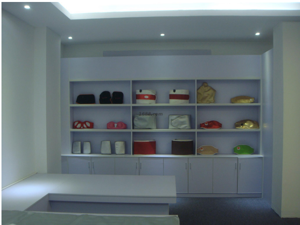
名称: 远红外线热敷按摩产品