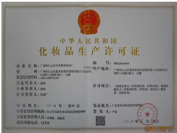
经营许可证证明材料