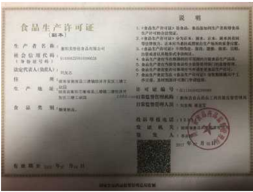
经营许可证证明材料