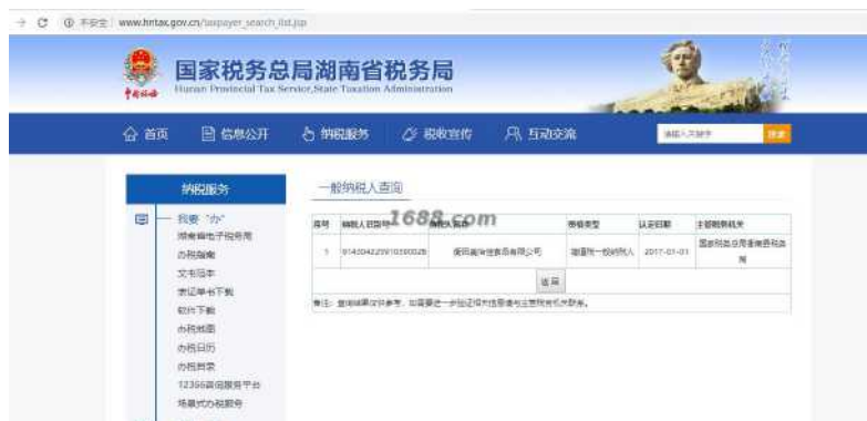
一般纳税人证明材料