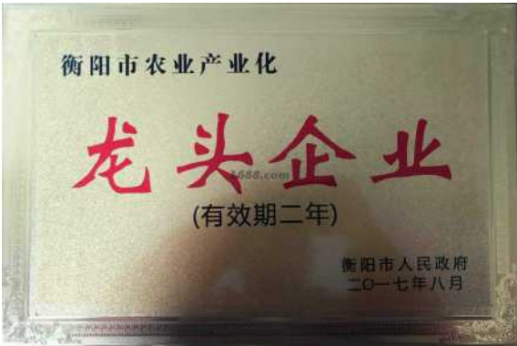
其他证书证明材料