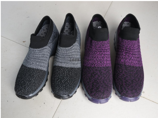
名称: 鞋 货品来源: 工厂货源

线上平台数量： 1 线上平台名单： 1688平台 https://shop1468947194613.1688.com