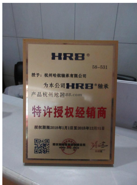
代理品牌证明材料