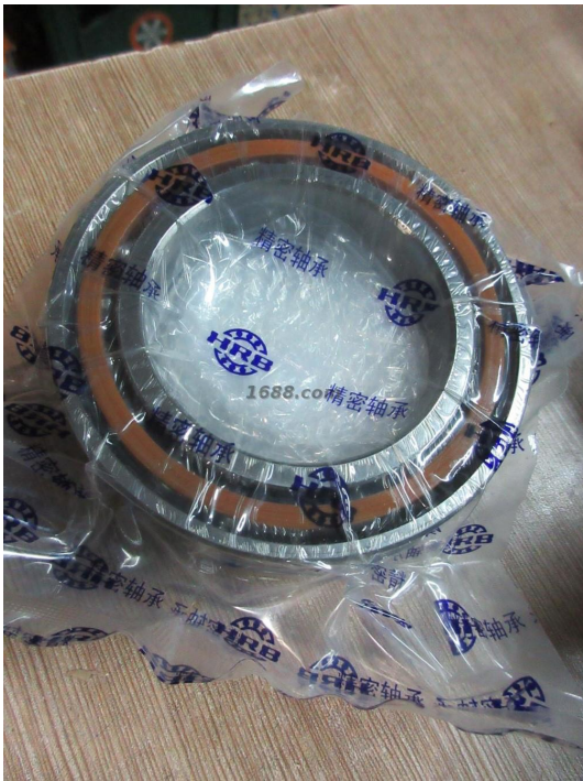
名称: 轴承 近1年销量: 2000000 套 货品来源: 工厂货源