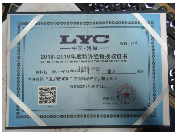
代理品牌证明材料