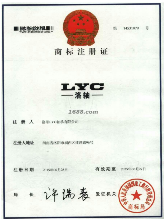
代理品牌证明材料