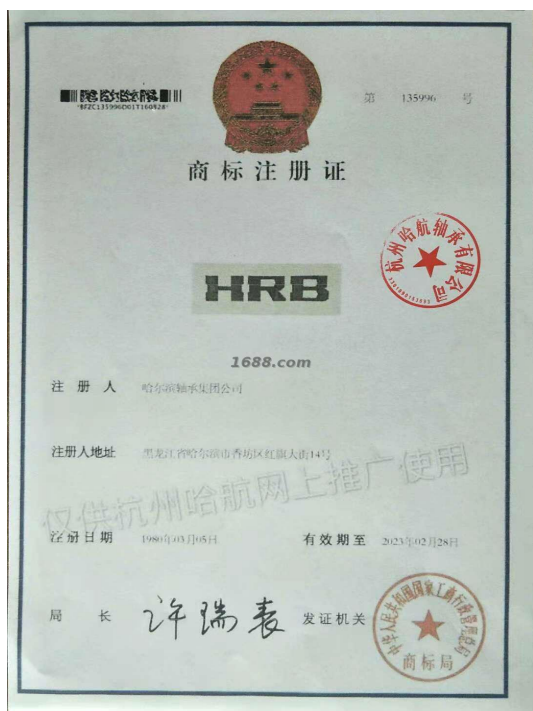
代理品牌证明材料