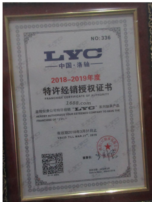
代理品牌证明材料