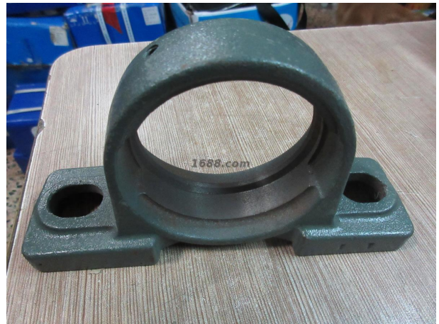
名称: 轴承零部件 近1年销量: 10000 个