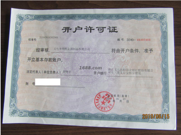
其他证书证明材料