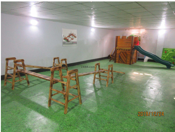
名称： 幼儿园户外体能设施