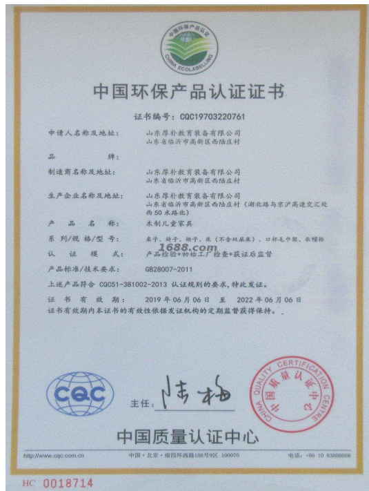
产品体系证书证明材料