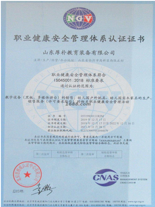
产品体系证书证明材料