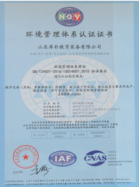
产品体系证书证明材料