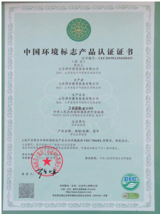
产品体系证书证明材料