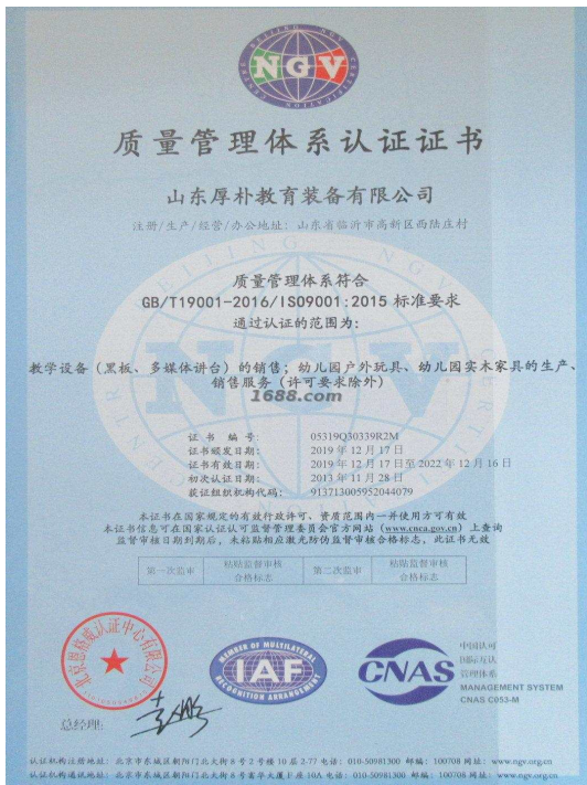
产品体系证书证明材料