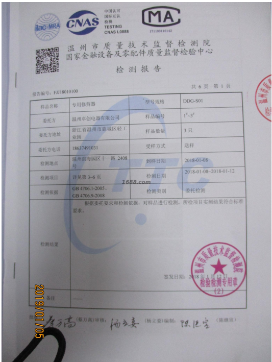
第三方品质检报告