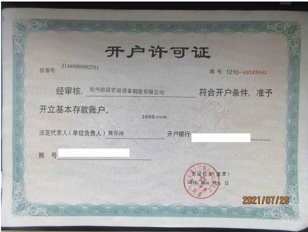
经营许可证明材料